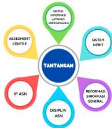
Gambar 2.5 Tantangan Pengembangan Manajemen ASN BKD Provinsi Jawa Barat