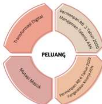
Gambar 2.6 Peluang Pengembangan Manajemen ASN BKD Provinsi Jawa Barat