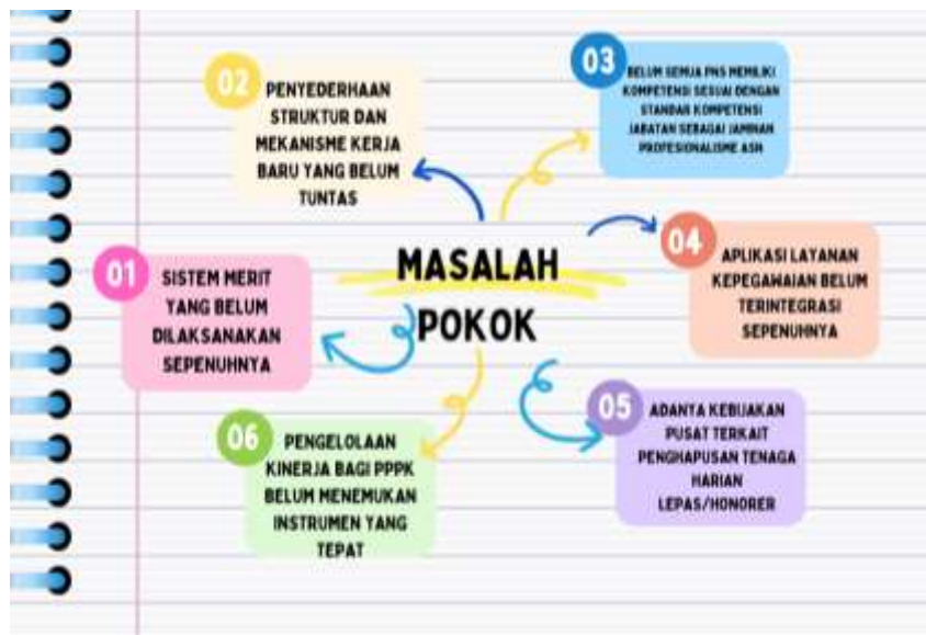
Gambar 2.4 Pemetaan Permasalahan untuk penentuan Isu Strategis

Isu dan masalah strategis yang menjadi perhatian utama pada tahun 2025 merupakan hasil dari evaluasi pelaksanaan program, kegiatan dan tugas pokok fungsi Badan Kepegawaian Daerah serta permasalahan yang timbul pada tahun-tahun sebelumnya.